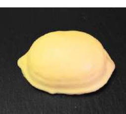
28. ハニーレモン ¥140