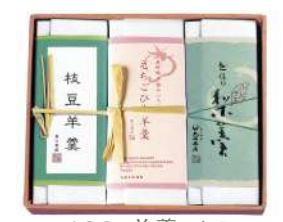
102. 羊羹3本入 枝豆羊羹、梨羹、えちごひめ羊羹 ¥4,620