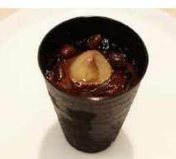
11. ほうじ茶プリン ¥320