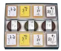
99. 梅しずく、岩間の水詰合せ 9個入¥2,760、11個入¥3,410、14個入4,260