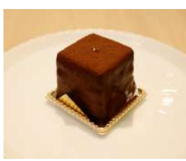
24. マリーアントワネット ¥400