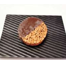
10. みなと浪漫 ¥220