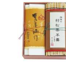
126-2. 豊年満作、村松栗羊羹 ¥3,720