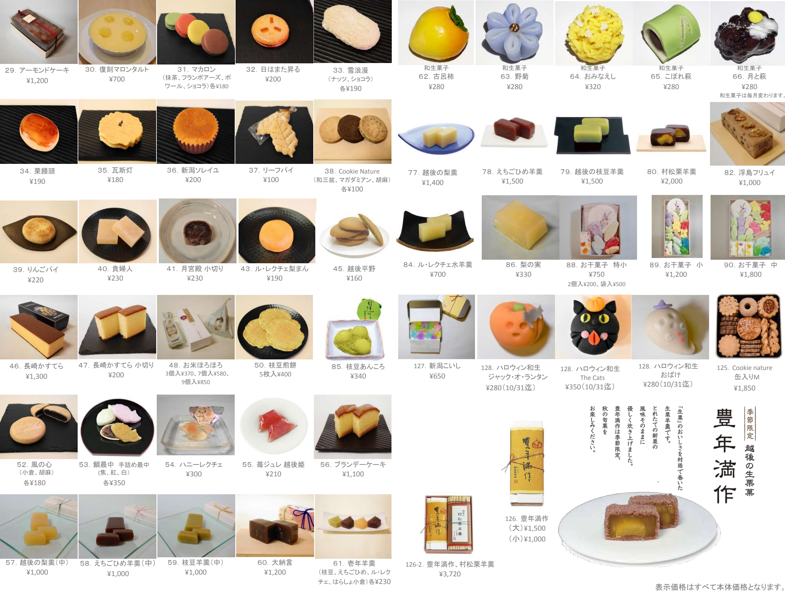
29. アーモンドケーキ ¥1,200