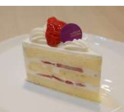
12. フレーズ ¥400