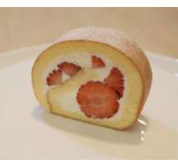
25. いちごロール ¥400