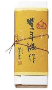
126. 豊年満作 (大)¥1,500 (小)¥1,000

「生栗のおいしさを村雨で巻いた 生栗羊羹です。 とれたての新栗の 風味そのままに 優しく炊き上げました。 豊年満作は季節限定、 秋の旬菓を お楽しみください。」