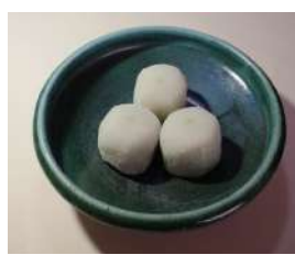
1. えだまめ餅 3個入¥490、5個入¥850、8個入¥1,310、10個入¥1,720、15個入¥2,400