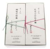
95. 羊羹中型2本入 梨羹、えちごひめ羊羹 ¥2,140