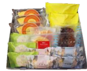
104. 名菓詰合せ16個入 ¥3,320