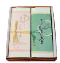
101. 羊羹2本入 梨羹、えちごひめ羊羹 ¥3,120