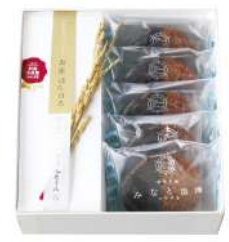
97. お米ほろほろ・みなと浪漫詰合せ ¥2,150