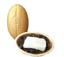
23. ノーサイド最中 ¥230