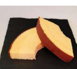
6. バウムクーヘンカット ¥200