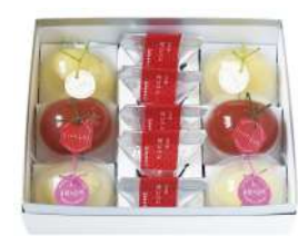
98. 新潟果樹園・苺ジュレ詰合せ ¥3,190