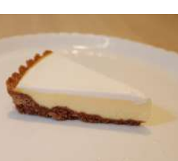
21. デンマークチーズケーキ ¥320