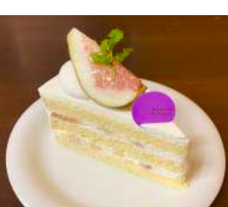
118. いちじくショート ¥400 西蒲区・あぐり悠々製