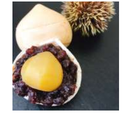
130. 新栗最中 ¥250