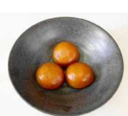
2. 黒糖饅頭 ¥100