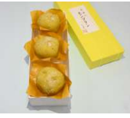
129. 越後のモンブラン 1個 ¥280、3個入 ¥940、6個入 ¥1,830