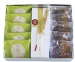
100. にいがた名菓撰 ¥3,170