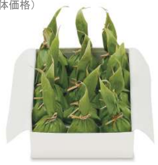
94. 童心笹だんご (こし、つぶ) 各¥220 5個入¥1,190、10個入¥2,320、15個入¥3,470、20個入¥4,620、30個入¥6,020