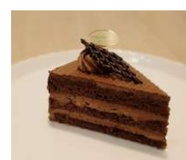
26. チョコレートケーキ ¥320