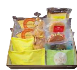
103. 名菓詰合せ12個入 ¥2,180