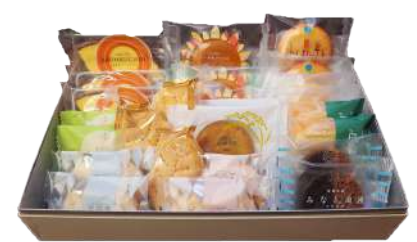
105. 名菓詰合せ26個入 ¥5,040