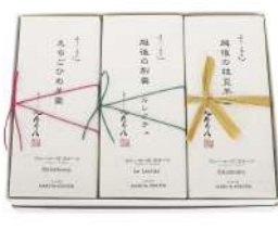
96. 羊羹中型3本入 梨羹、えちごひめ羊羹、枝豆羊羹 ¥3,170