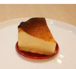
22. プロヴァンスチーズケーキ ¥400(本体価格)