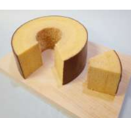
5. バウムクーヘン ¥1,000、¥1,200、¥1,500、¥2,000、¥3,000