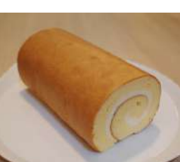
18. たまごロール ¥750 ハーフ ¥500