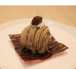
17. モンブラン ¥420