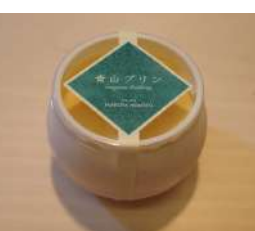
20. 青山プリン ¥150