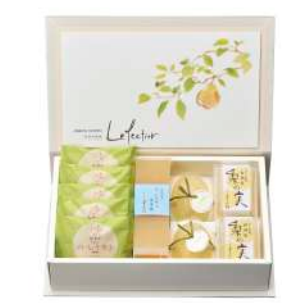
106. ル・レクチュエ旬菓撰 ¥3,200