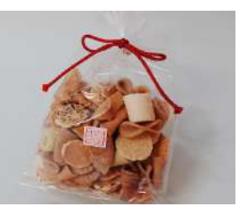
93. ふきよせ ¥550