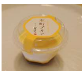
19. 本町プリン ¥150