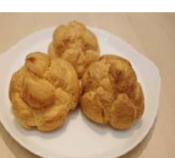
16. シュークリーム ¥120