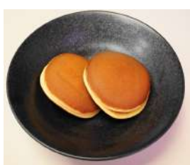
14. だら焼き ¥130