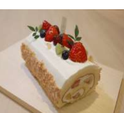
3. 南天フルーツロール ¥1,200